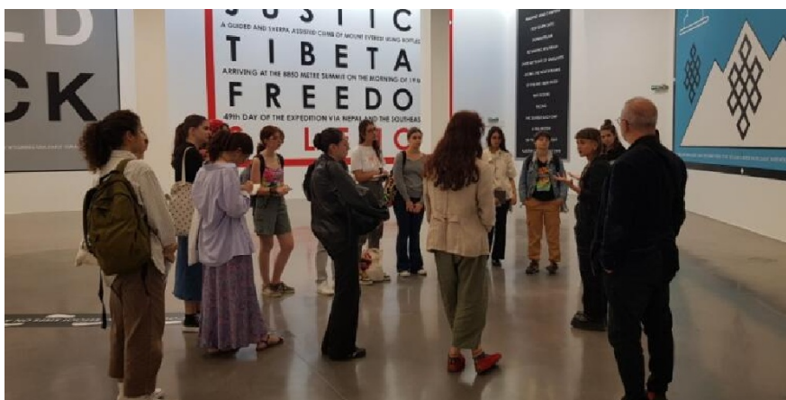
Accueil des étudiant-es de l'ESAA au FRAC SUD le 29/09/2023

Le FRAC est un lieu ressource pour les étudiant-es et les jeunes diplômé-es des écoles d'art de la Région Sud - Provence-Alpes-Côte d'Azur. Dans le cadre de l'anniversaire de ses 40 ans et de la convention de partenariat ESAA - Frac Sud - Cité de l'art contemporain , des événements jaloneront l'année 2023-2024, commençant par un chantier-école d'une semaine en octobre.