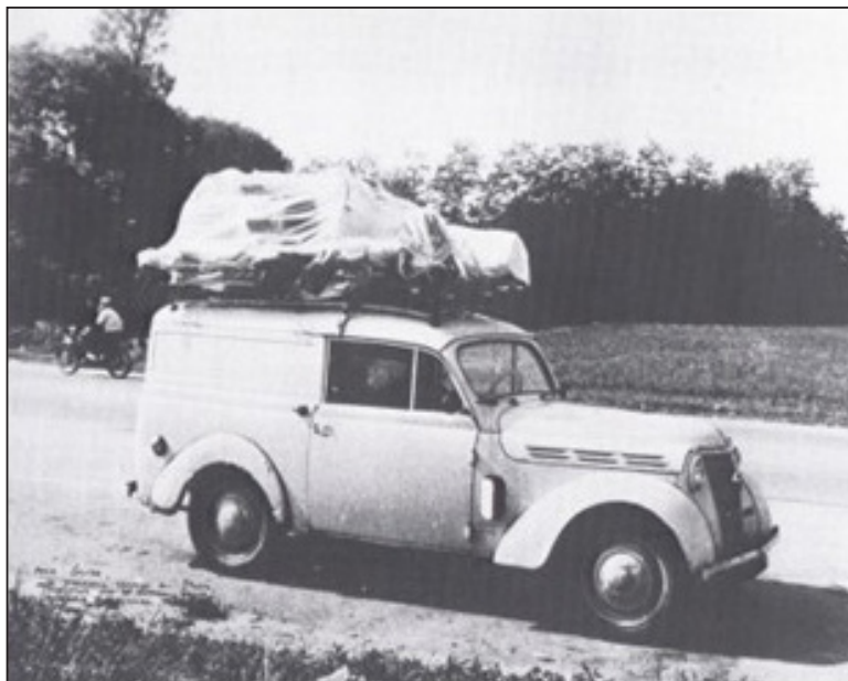
Premier voyage de Christo en Italie, son exposition empaquetée sur le toit de sa voiture, juin 1963